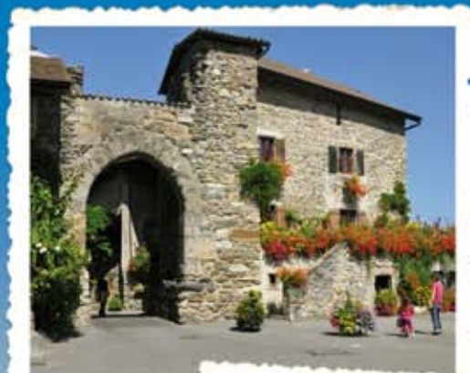
La Porte de Rovarée

... QUELQUES SOUVENIRS DE CROISIÈRE ... CRUISE PICTURES