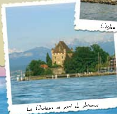
Le Château et port de plaisance