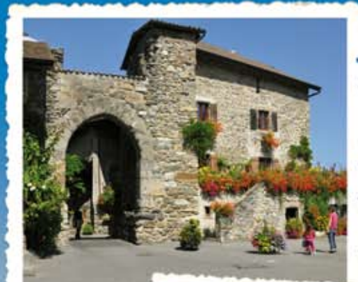
La Porte de Rovarée

... QUELQUES SOUVENIRS DE CROISIÈRE ... CRUISE PICTURES